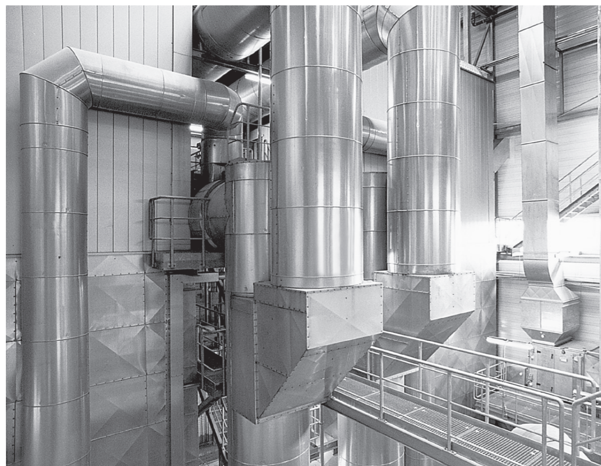
Blick auf den Gewebefilter