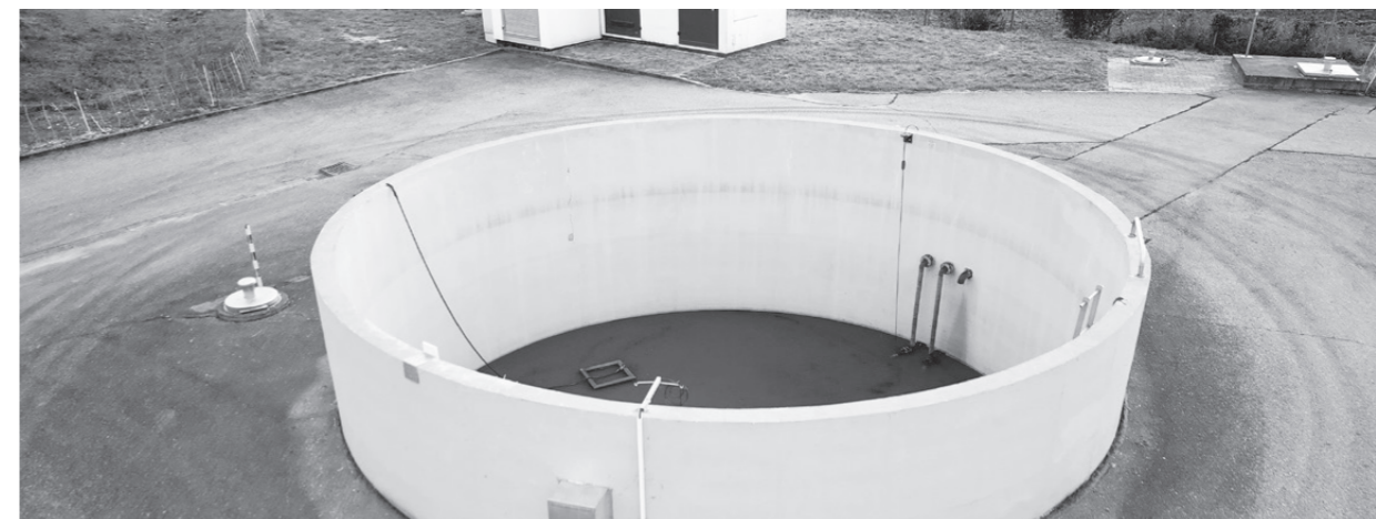
Sickerwasserbecken

Die Deponie befindet sich in der Nachsorgephase. Das Deponieverhalten wird kontinuierlich überwacht und das anfallende Sickerwasser und Deponiegas wird erfasst. So konnten im Jahr 2023 insgesamt 11.128 m 3 Sickerwasser in der deponieeigenen Behandlungsanlage vorgereinigt und zur weiteren Reinigung dem Klär-